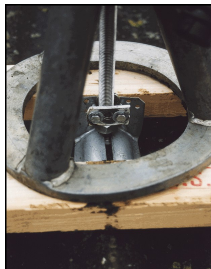
Billede af montage med V-beslag til trækforsøg.