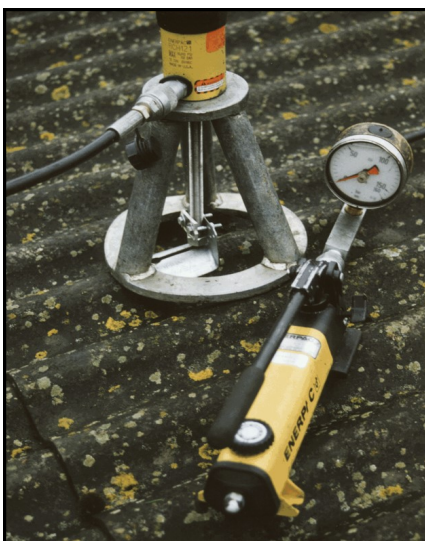
Billedet viser trækprøveudstyr, der måler max. udtræksstyrke.